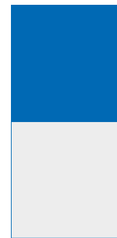
1/2 Seite 160 x 150 mm