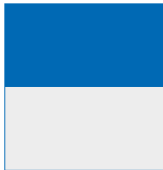
1/2 Doppelseite 320 x 150 mm