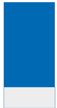
Anzeigenstreifen 160 x 60 mm