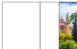
1/2 Seite hoch 105 x 270 mm